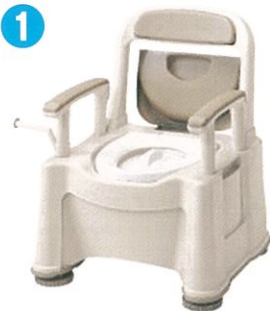
品名: ポータブルトイレ座楽 背もたれ型SP 品番: SPTSP