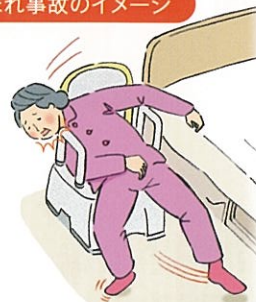
はさまれ事故のイメージ

ご使用中のお客様には大変ご迷惑をおかけいたしますことを深くお詫び申し上げます。何卒ご理解とご協力をお願い申し上げます。