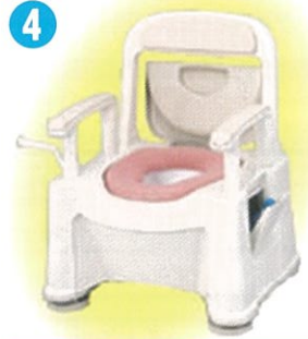
品名: ポータブルトイレ座楽背もたれ型 SP小口径便座タイプ 品番: SPTSPMB