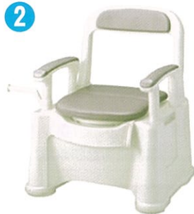
品名: ポータブルトイレ座楽背もたれ型 SPソフト便座・便フタタイプ 品番: SPTSPS