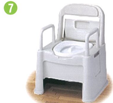
品名: ポータブルトイレ座楽 背もたれ型HD 品番: SPTH