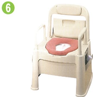
品名: ポータブルトイレ座楽 背もたれ型SB 品番: SPTSB