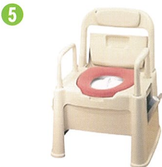
品名: ポータブルトイレ座楽 背もたれ型 品番: SPTSD