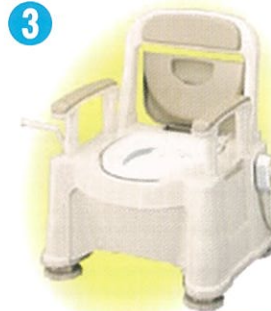
品名: ポータブルトイレ座楽 SP あたたか 品番: APTSP