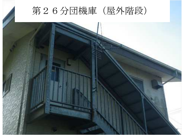
第 2 6 分団機庫（屋外階段）