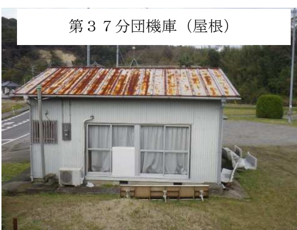
第 3 7 分団機庫（屋根）