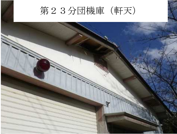
第 2 3 分団機庫（軒天）