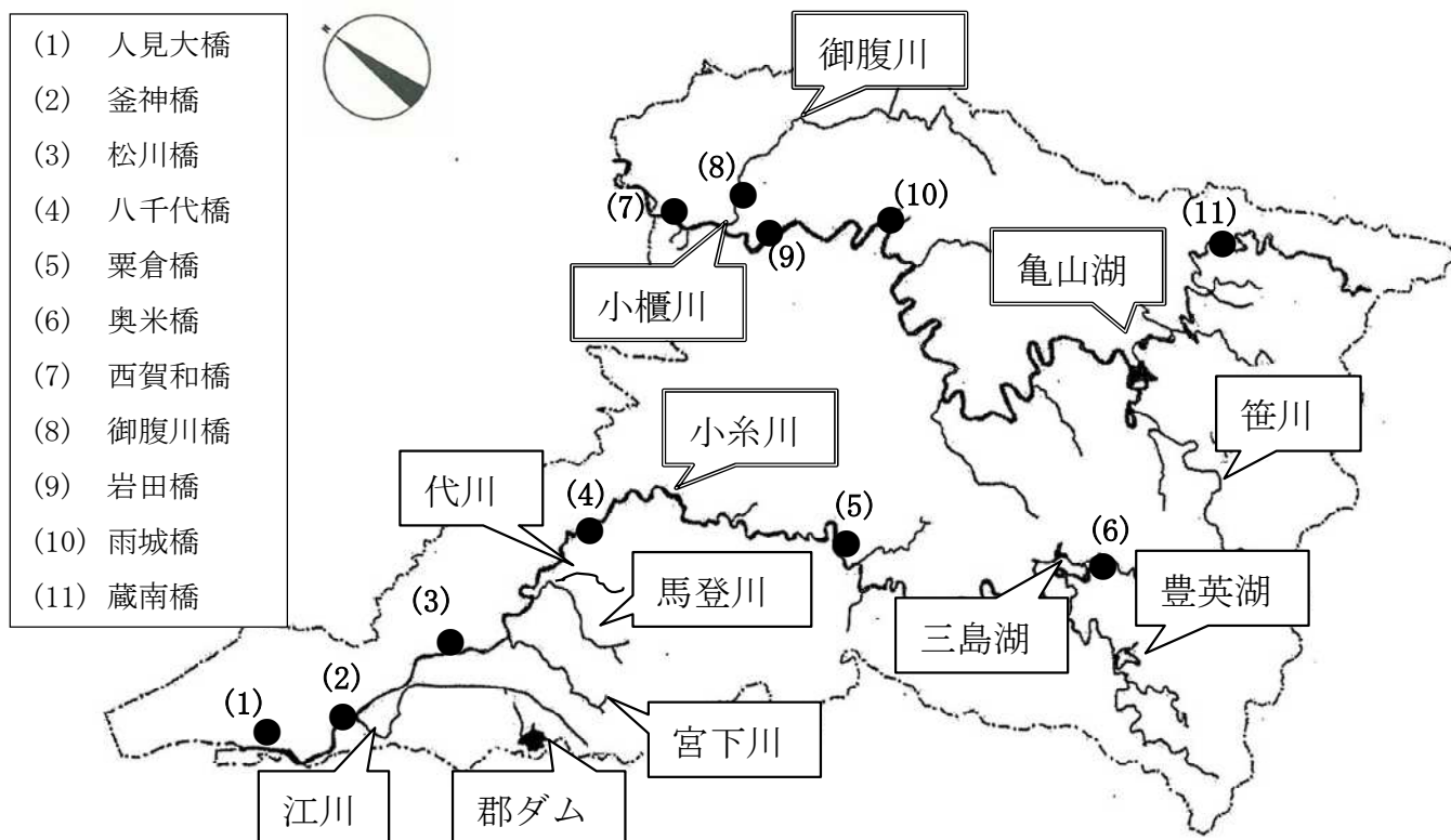
(図 7-1) 河川水質調査地点

本市臨海部には、日本製鉄㈱等の工場群が立地し、海岸線は人造護岸となっている。広域的閉鎖性水域である東京湾の水質は、工場・事業場の排水や生活排水の影響を受けており、排出規制や下水道整備によって一時期に比べて改善されてきたものの、未だ十分とはいえない状況である。