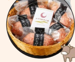
和牛ハンバーグ(冷凍) 5個セット