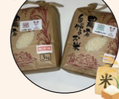
新米コシヒカリと新米粒すけの食比べセット(3kg)