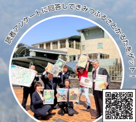
アンケートの回答はこちらから！

念して令和版君津ふるさとかるたとしてリニューアル。読み札を子どもたち、絵札を地域の皆さんが考えるなど、君津の魅力がさらに詰まったかるたとして生まれ変わり、平成から令和にわたって長年、子どもたちに親しまれてきました。イベントを通して君津の魅力を再発見し、新たな未来へ向かってともに歩みを進めていきましょう！イベントの詳細は3・4ページで紹介しています。