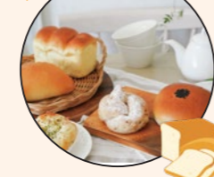
手作り米粉パン(冷凍) 12個セット