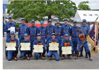
選考会（ポンプ車操法）で優勝した第15分団の皆さん

6月6日、消防操法選考会・訓練披露会が市民文化ホールで開催されました。消防団員が日頃の訓練の成果を遺憾なく発揮した結果、選考会（ポンプ車操法）では第15分団が優勝に、訓練披露会（小型ポンプ操法）では第19分団が最優秀賞に輝きました。詳しくは市ホームページをご確認ください。