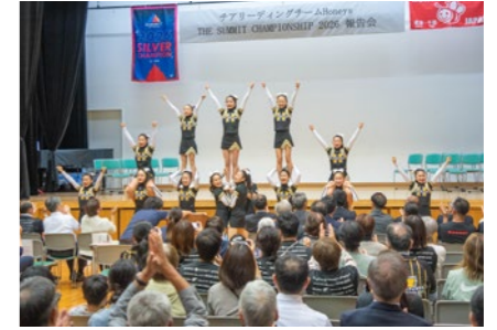
会場に集まった皆さんとYMCA 君津パージョンをを行いました

6月8日、Honeysの皆さんが世界大会での結果報告会を開催しました。Honeysの皆さんのこれまでの歩みを振り返る映像や、世界の舞台で披露した演技などが上映されたほか、大会に臨んだ際の心境やエピソードなどを選手の皆さんが語り、会場は大きな感動に包まれました。