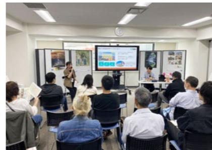
当日は移住を検討しているたくさんの方が集まりました

5月23日、東京都千代田区のふるさと回帰支援センターで、「君津市×木更津市 合同移住セミナー」を開催しました。市内での実際の暮らしや移住事例の紹介、先輩移住者とのトークを通じて、都心へのアクセスがよく、暮らしの利便性と豊かな自然を兼ね備えた君津市の魅力を参加者に伝えました。