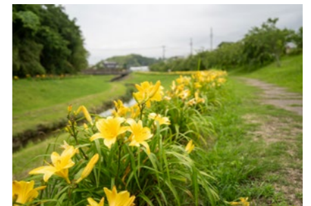
色鮮やかなニッコウキスゲが宮下川沿いを彩っています

宮下川沿いに咲いている約1,800株のニッコウキスゲの花が見頃を迎えています。この花は、市民が主役のまちづくり事業に採択されている「宮下緑地をきれいにする会」の皆さんが植えたもので例年7月上旬まで見頃が続きます。きれいに整備された川沿いをゆったりと散策してみたいいかがでしょうか。