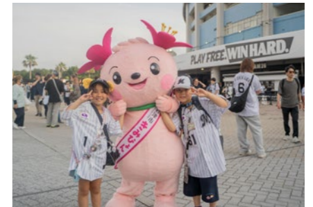
きみびよんも一緒にPR活動を行いました！

6月19日・20日の2日間にわたりZOZO マリンスタジアムで千葉県を盛り上げるイベント ALL FOR CHIBA が開催されました。各自治体の紹介ブースやマスコットキャラクターによるPRなどが行われ、来場した方からは「2軍球場の誘致を応援しています」などの声も寄せられました。