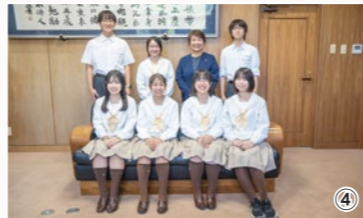
写真：①中学校合同生徒会（会場：周西中学校）②君津高等学校 ③君津青葉高等学校 ④翔凜高等学校