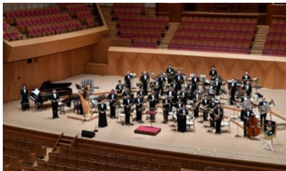
心に響く音楽隊の旋律をお楽しみください！