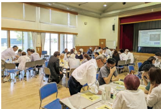
避難シミュレーションワークショップの様子

2006年5月14日に開館した周西公民館は、地域のみなさま、利用者のみなさまに支えられ、開館から20年の節目を迎えました。そこで、今年度を「開館20周年」として、様々な取り組みを実施していくことになりました。ぜひご注目、ご参加下さい！ ●開館20周年記念事業 地域と公民館の歩みを振り返りながら、これからの地域発展の足がかりとすることを目的に、記念事業に取り組みます。 ①20周年記念誌の発行 10月頃発行予定。冊子版とPDF版を想定。 ②記念式典 11月3日（火・祝）。アトラクションも交えた楽しいセレモニーを目指します。来場者には記念品をプレゼント予定です。 ③記念文化祭 11月3日（火・祝）から8日（日）まで開催。例年の模擬店や催しは7日（土）・8日（日）の実施予定。 ④記念イベントなど 支え合う防災 5月17日、避難するときの支援をテ-