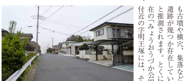
写真4 古墳所在地付近の坂道

この付近にはそれ以外にも古墳や横穴、集落などの遺跡が幾つか存在していると推測されます。とくに現在の「みょうおうづか公園」付近の字明王塚には、その