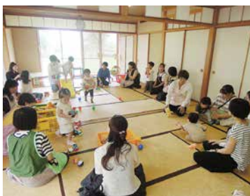
昨年度のたんぼぼ学級のひとコマ

●周西地区地域づくり協議会支援事業 通年 ●公民館だより「はまっぺ」発行 年4回 ●君津地区公民館運営審議会（4館合同）5～3月 詳細・募集は、随時お知らせいたします。