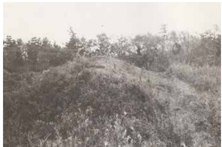
写真1 東仲田古墳全景

石棺は砂岩材を組み合わせて作られたもので、蓋石6枚、側面の壁に各2枚、両端の壁に各1枚、底石3枚から構成され、長さ213cm、幅75cm、高さ(深さ)