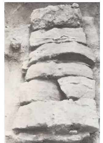
写真2 箱形石棺の蓋石