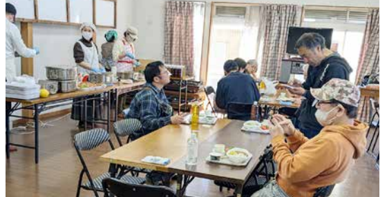
神門での地域食堂開催の様子