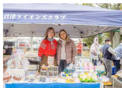
ウクライナ支援のブース

○今後について教えてください。駅前活性化に向けて、将来的には、中高生を中心としたシャッターアートや、ミニFM局設置なども考えています。