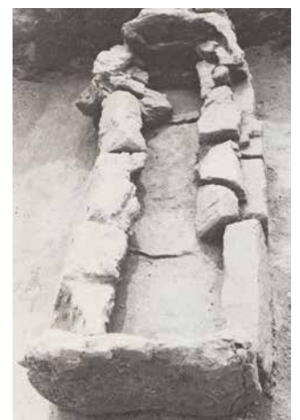
写真3 箱形石棺内部

40cmの大きさでした。石棺は長辺をほぼ東西に向けて置かれていました。内部を発掘した結果、底石の北西隅から鉄器の破片1点が出土しただけで、人骨も残っていませんでした。石棺の蓋石に動かされたような形跡があり、盗掘を受けているものと考えられました。