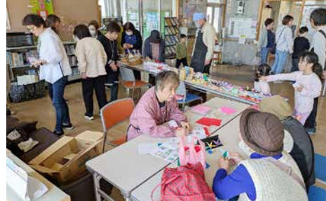
プレイベントの様子