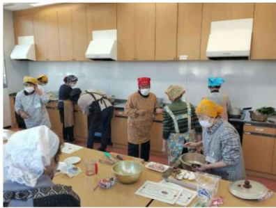
手際よく調理しています

本事業は、住み慣れた地域でいつまでも元気に住み続けられるように、全ての人にかかわる「食