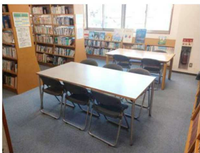
閲覧席が10席あります

上総公民館の2階には中央図書館上総分室があり、蔵書約1万6千冊や新聞1紙があります。