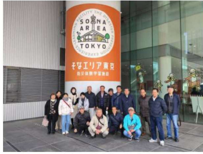
そなエリア東京の玄関にて

本事業は、令和元年房総半島台風を契機に、自治会長・民生委員・主任児童委員を地域のリーダー層と位置づけて、地域の防災力を高めるための学習会です。 3月11日(水)に移動学習として、東京臨海広域防災公園(そなエリア東京)に行きました。大地震の発生後、救助までの72時間を生き延びるための行動を、体験やクイズを通じて学びました。