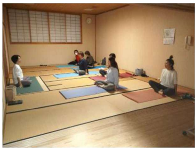
心も体もリフレッシュ

YOGAーるは、令和5年に発足した女性のヨガサークルです。「ヨガ」と「ガール」の組み合わせが名前の由来です。