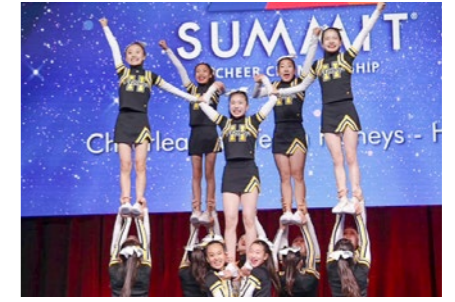
【大会報告会】日時:6月8日(月)午後7時15分から/会場:生涯学習交流センター・多目的ホール

5月1日、アメリカフロリダ州で開催された「THE SUMMIT CHAMPIONSHIP 2026」にチアリーディングチーム Honeys が出場し、世界各国から集まったチームの中で、見事準優勝に輝きました。6月8日には大会報告会が行われます。ぜひお集まりください!