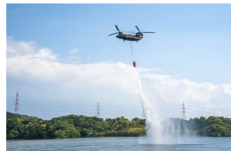
郡ダムで実施したヘリコプターでの放水訓練の様子

5月14日、大規模な林野火災発生時における災害対応力の強化を図るため、千葉県との共催により、警察・消防・自衛隊などの関係機関が連携した林野火災対策訓練を実施しました。市庁舎での、災害対策本部運用訓練のほか、郡ダムではヘリコプターを使用した給水・放水訓練などを行いました。