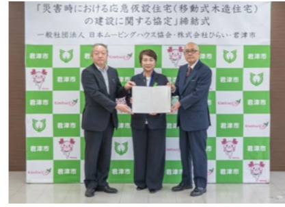
災害が発生した際は、被災した方の住居の確保に努めます

4月23日、(一社)日本ムービングハウス協会と株式会社ひらいの2社と「災害時における応急仮設住宅(移動式木造住宅)の建設に関する協定」を締結しました。災害発生時は、協定をもとに災害で住家を失い自立再建が困難な被災者に対し、応急仮設住宅の供給を進めます。