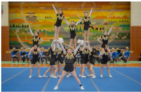
君津市消防音楽隊の演奏に合わせて、パフォーマーの披露も行われました。

4月12日、アメリカで開催される世界選手権大会「THE SUMMIT CHAMPIONSHIP 2026」への出場を決めたチアリーディングチーム Honeys の壮行会を行いました。会場には多くの人が集まり、夢の舞台へ挑戦する選手たちへ熱い声援が送られました。