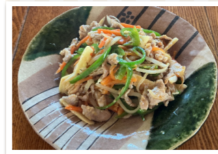
彩りチンジャオロース