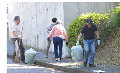
身近なところからきれいにしましょう

日時 = 5 月 31 日 (日) 午前 8 時から 10 時 ※雨天の場合、6 月 7 日 (日) に順延 注意事項 = ▼ 道路やその周辺の散乱ごみ (空き缶、空き瓶など) を収集します。粗大ごみ・家庭ごみは回収しません ▼ 可燃物、不燃物を分別して集め、公共用ごみ袋に入れて可燃ごみステーションに置いてください。ごみは翌日以降の可燃ごみの日に回収します ▼ 収集時には、事故やけがのないように注意してください ▼ 実施・延期・中止の連絡は、当日午前 7 時に防災行政無線や市のメール配信・公式 LINE でお知らせします 〇 環境衛生課 ☎ (56)1224 / 当日：清掃工場 ☎ (52)5353