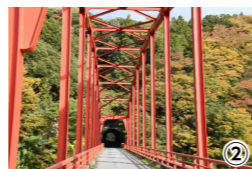
①撮影場所：九十九谷展望公園 ②撮影場所：亀山湖 小月橋