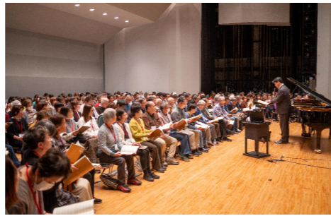
当日の鑑賞券は、窓口や公式ホームページで販売中です！