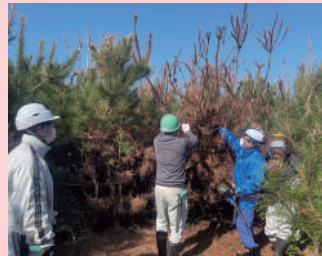
緑の募金の森 (海岸林) の造成 (旭市)