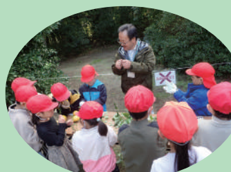
小学校の校外学習支援 (袖ヶ浦市)