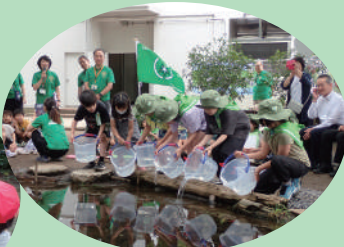
緑の少年団による学校や 地域の緑化活動 (流山市)