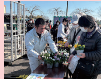
さんむ苺まつり (山武市)