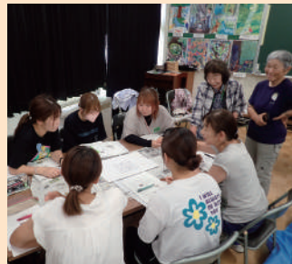
みどりの教室 (袖ヶ浦市)