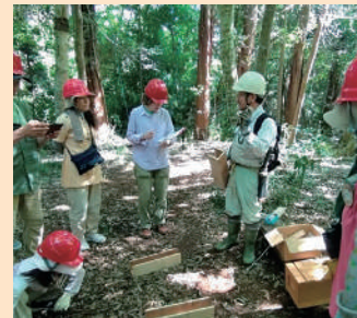
おとなの木育 (千葉市)