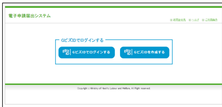
【本システムのログイン画面イメージ】

本システムでご利用できるGビズIDのアカウント種類は、「GビズIDプライム」と「GビズIDメンバー」のみになります。