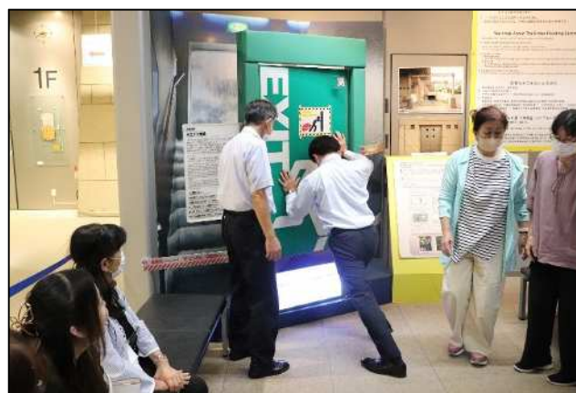
膝まで浸水した扉を開けようとする石嵯会長