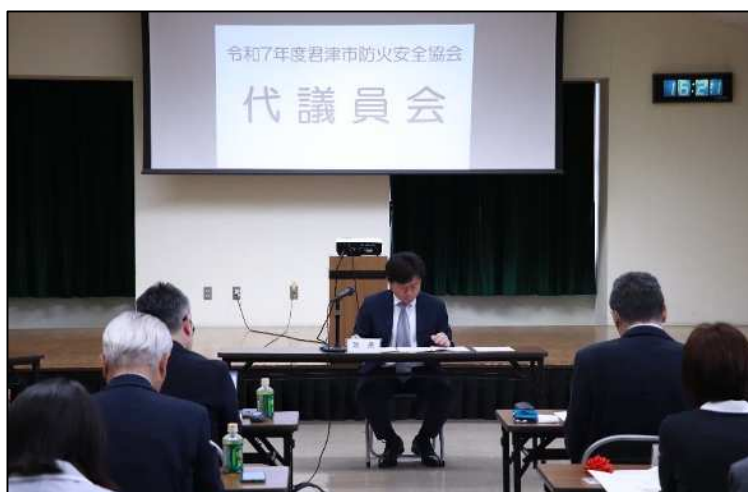
議長を務める石寄会長

令和7年5月26日（月）に消防本部大会議室において令和7年度代議員会が開催され、理事会の議題については原案どおり全て可決、承認されました。