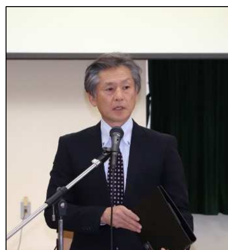
田村顧問（消防長）あいさつ