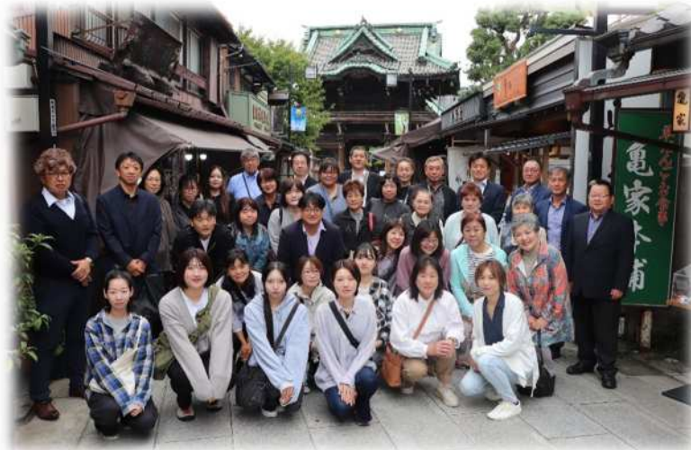
柴又帝釈天参道にて記念撮影