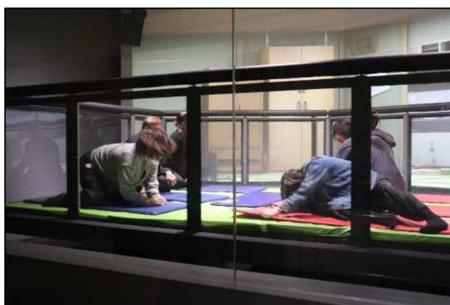
地震を体験する参加者の皆さん

防災館は、皆さんの安全な暮らしを目指し、楽しみながら地震の揺れの体験、初期消火や応急救護、火災の煙からの避難要領など、防災に関する知識や技術を学んでいただく体験施設です。こうした体験は、町会・自治会の防火防災訓練や、学校や企業新入社員に対する防災教育などにも活用され、効果を上げています。当日は様々な地震の揺れや暴風雨等を実際に体験しました。