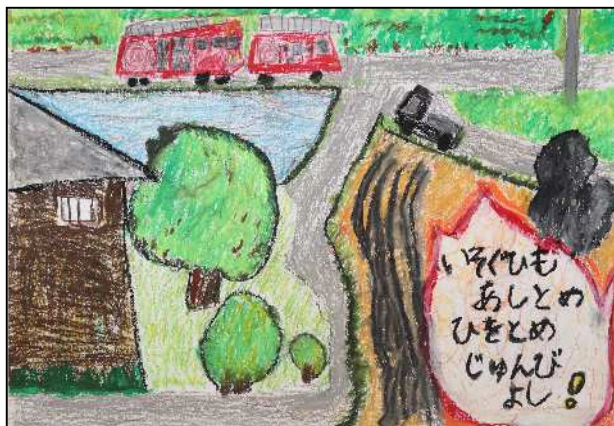
君津市立小糸小学校