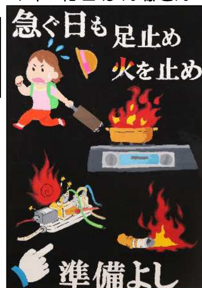
君津市立八重原中学校