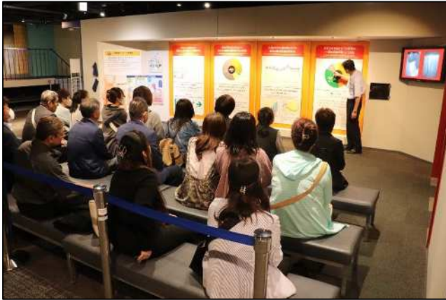
防災館職員による説明