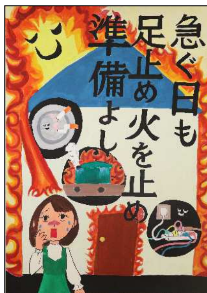
君津市立八重原中学校