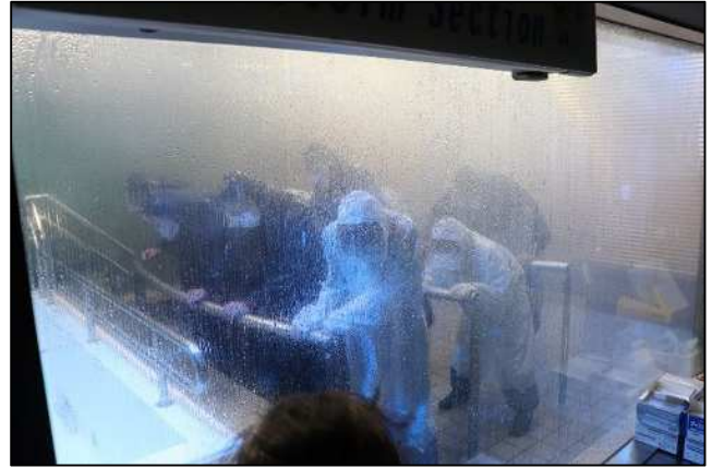
暴風雨を体験する参加者の皆様