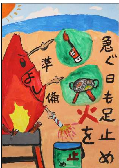
君津市立八重原小学校