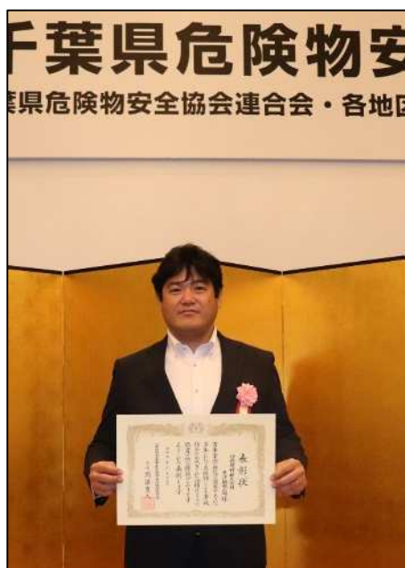
日鉄建材株式会社 君津鋼板工場 様

【優良危険物取扱者】 日本製鉄株式会社東日本製鉄所君津地区 ありはらまさとし 様 君津共同火力株式会社 ばばひとし 様 君津市農業協同組合 かまだじゅんや 鎌田順也 様