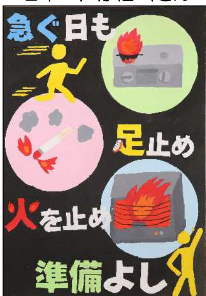
君津市立八重原小学校