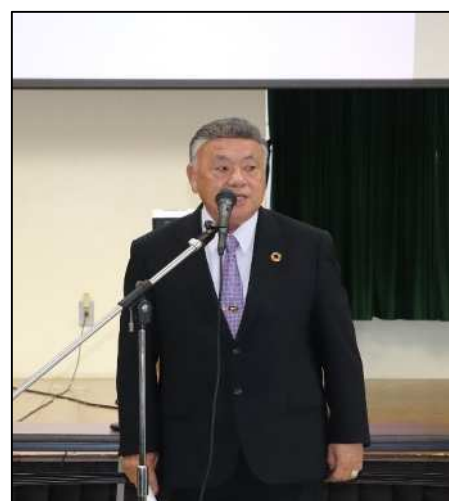
開式の言葉 影山副会長