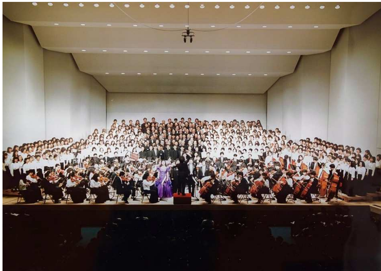
君津市民文化ホール開館記念事業として開催した「みんなの第九演奏会」(1990年9月)

(7)その他 楽譜をお持ちの方はご持参ください。君津市民文化ホールでも購入可能です。