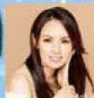
ソプラノ 森 麻季