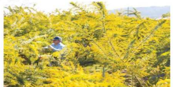
咲き誇る一面のミモザ（ここに行くよ）