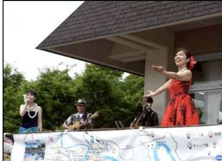
(会場・ステージイベントの様子)