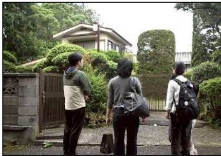
(空き家ツアーの様子)