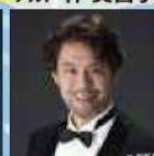
バス 平野 和