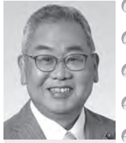
公明党 野上 慎治 議員