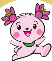
君津市 マスコットキャラクター きみぴん

10月3日、保健福祉センターふれあい館で、市内の6蔵及び富津市の2蔵の「かずさ八蔵」と「はちみつ工房」が出店した「第8回きみつの地酒まつり」が開催されました。会場では、各蔵自慢の50種類以上の地酒に加え、ウイスキー、ミードの試飲や利き酒コーナーが設けられたほか、キッチンカーなども出店し、大勢の人で賑わいました。君津市は千葉県内最多の酒蔵を有し、酒造りが盛んなことから平成26年10月1日に「きみつの地酒で乾杯を推進する条例」※を施行し、君津市にゆかりのあるお酒（地酒）による乾杯を推進しています。