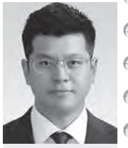
きみつ未来 みつたけ 満武

A 冷暖房は民間活力を導入した整備を検討。弓道場は7年度中にひさしを設置する予定であり、床板の補修は指定管理者と協議していく。