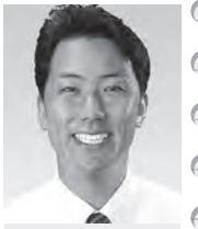
創政会 しもだ 下田