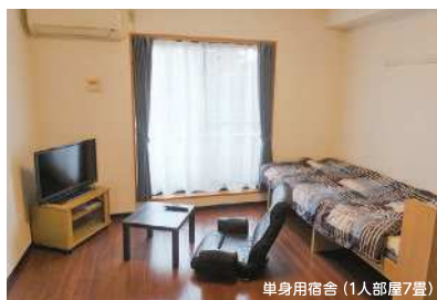
単身用宿舎(1人部屋7畳)