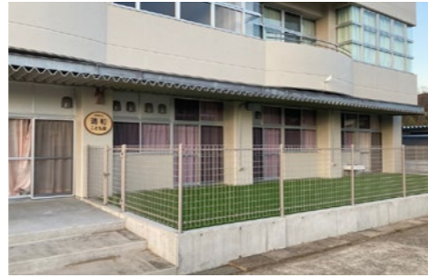
旧秋元小学校の校舎を活用した新しいこども園です

一時休園していた清和保育園が、4月1日から清和こども園として開園しました。令和6年1月に開館した清和地域拠点複合施設「おらがわ」に併設し、幼稚園と保育園の機能を併せ持つ施設です。一時預かり保育や子育て相談、地域との交流などを展開していきます。 保育課 ☎(56) 1527