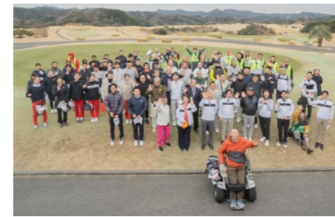
ボランティアとして、かずさ青年会議所等の皆さんにも大会運営のお手伝いをいただきました。

3月18日、新君津ベルグリーンカントリー倶楽部で第1回君津市長杯「ジュニア & 障害者交流ゴルフ大会」が開催されました。ジュニア選手と障害者ゴルファーがペアを組み、共に支え合いながら競い合う日本初の大会です。参加者たちは、ゴルフを通じてお互いの理解を深めました。