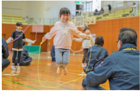
市ホームページで参加者の詳しい記録と結果を掲載しています

2月17日、君津市民体育館で第44回君津なわとび大会を開催しました。親子とび・両足とび・二重とびなどの個人種目のほか団体種目の長縄とびが行われ、選手たちは、真剣な表情で自身の記録に向き合い、日頃の練習の成果を競い合いました。