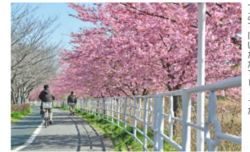
君津の春を見つけない、おでかけしてみたいかたがでしょうか？

広報きみつの読者の皆さんから最もオススメをいただいた君津の桜の名所 第1位は「小糸川沿岸遊歩道」でした！小糸川下流の沿岸部には遊歩道が整備されているため、のんびりと桜や菜の花などの季節の花々を楽しむことができます。お散歩にもピッタリな君津を代表する桜の名所です。