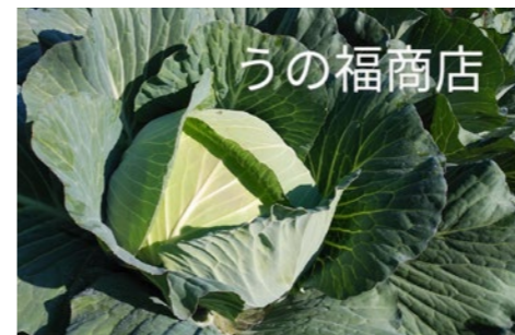
今後もキャベツの出荷が続く7月まで寄贈いただける予定です

合同会社うの福商店から学校給食のためにキャベツの寄贈をいただいています。地元産の野菜を食べて元気に育てて欲しいという思いで、昨年11月から今年の2月までに寄贈いただいたキャベツの総量は合計4,848kg(毎月500個余り)。サラダやスープにして市内全ての学校給食で美味しくいただいています。