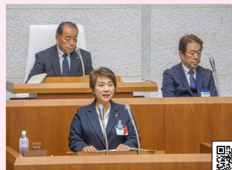
今年度の施政方針を述べる石井市長

せが多くの人に広がり、次世代に繋がっていく持続可能なまちづくりを推進していきます。 4・5ページでは、今年度取り組んでいく事業を5つの柱ごとに紹介しています。予算の編成にあたっては、メリハリをもって施策を展開するため、現状を踏まえた重点取組施策（子育て・教育・住まい）に取り組むこととしました。 2月15日の令和6年第1回定例会で石井市長が示した今年度の施政方針の全文と予算概要は、市ホームページや中央図書館で見ることができます。