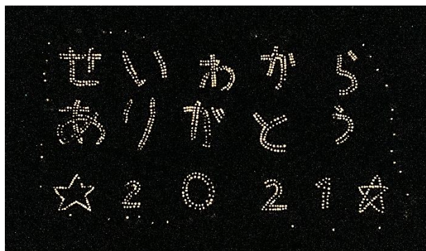
グラウンドをドローンで上空より撮影