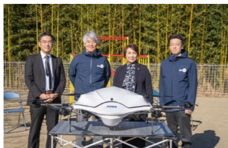
新しい物流サービスの構築を目指して実証実験を続けていきます

1月14日、清和地域で中山間地域でのドローン配送の実証実験が行われました。住民の理解度向上や定期飛行に向けた課題の洗い出しを目的として行った今回の実験では、清和地域拠点複合施設(おらがわ)から宿原青年館前市有地までの約7kmの距離を、約21分で配送しました。