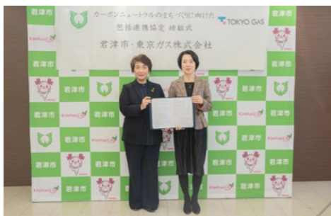
エネルギーの地産地消や、効率化を推進していきます！

12月21日、東京ガス株式会社と、カーボンニュートラルのまちづくりを目的とした包括連携協定を締結しました。公共施設の省エネルギー化や公用車の電動化に向けた取り組みをはじめ、地球温暖化の防止に関する普及啓発などに取り組み、カーボンニュートラルのまちづくりを推進していきます。