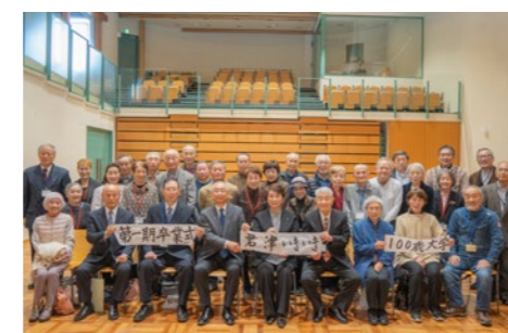
最高年齢91歳、平均年齢78.6歳の皆さんが、約4カ月にわたって老い方の基礎を学びました

12月20日、中央図書館で君津いきいき100歳大学の卒業式が行われ、一期生として29人の卒業生が誕生しました。令和5年9月から始まったこの取り組みは、人生100年を元気に生きるコツなどを学ぶため、市民が主体となって企画・運営が行われました。今後2期生の募集も予定されています。