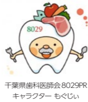
千葉県歯科医師会8029PR キャラクター もぐじい

フレイル(年齢とともに筋力や心身の活力が低下し、介護が必要になりやすい状態)の前症状ともいわれるオーラルフレイル(口腔機能の衰え)などについてわかりやすく解説します。 日時＝2月12日(月・休) 午後2時から4時 講師＝野本たかと氏(歯科医師、日本大学神戸歯学部障害者歯科学講座教授) 定員＝500人(先着順・申込不要) ☎ (一社)千葉県歯科医師会 ☎043(241)6471