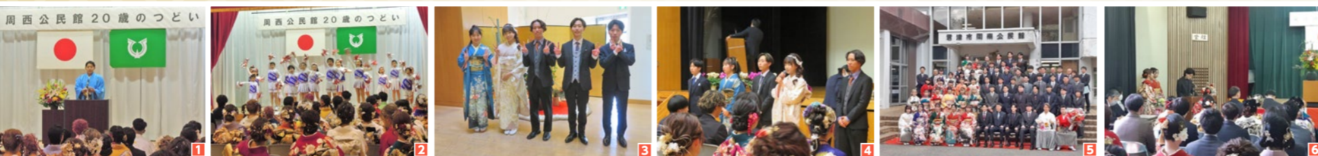
各会場の様子 1,2 周西地区 / 3,4 周西南地区 / 5,6 周南地区 / 7,8 小糸地区 / 9,10 小櫃地区 / 11,12 久留里地区 / 13,14 松丘地区 / 15,16 亀山地区