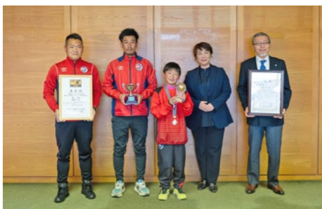
優勝を目指して、さらに練習に励みます！

12月22日、君津 USC (君津ユナイテッドスポーツクラブ) の選手代表とコーチ関係者の表敬訪問を受けました。2023年度千葉県ケーブルテレビ杯第38回千葉県U-9サッカー選手権大会に出場し、参加198チームの中で準優勝を果たした同クラブ。選手たちからは喜びの報告を受けました。