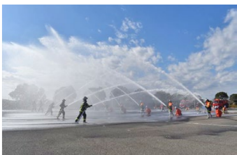
関係機関の士気高揚と団結を図りました！

1月7日、君津市民文化ホールで君津市消防出初式を開催しました。市内の消防関係機関が一堂に会して、地域の安全安心を願いました。団員行進や、日頃の訓練の成果などが披露されたほか、水消火器体験や消防車両の展示などが行われ、会場を訪れた人たちは防災への理解を深めていました。