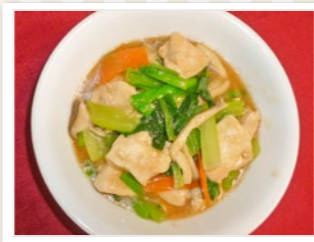
小松菜と鶏むね肉の オイスター炒め煮