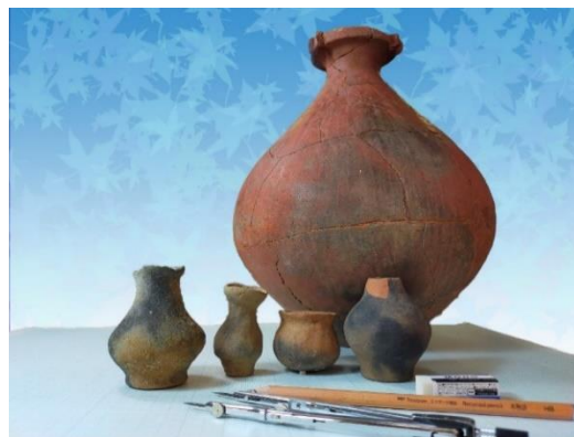
約10cmの手のひらサイズの土器