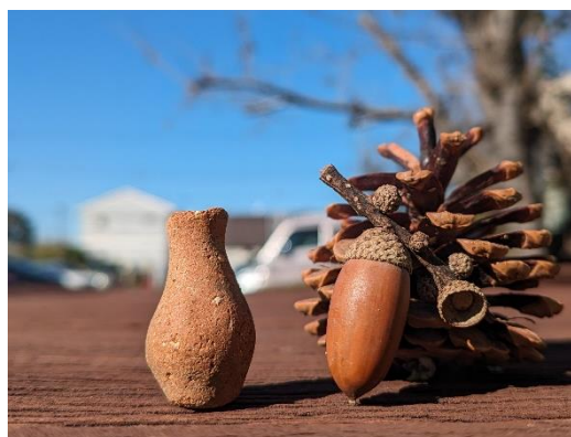
君津市内から見つかった3cm未満の ミニチュア土器

2その他 定員20名(事前申込制、先着順)※12月1日(金)から、申込フォームで受付