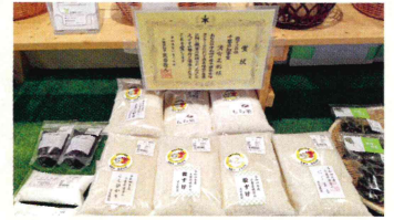
令和4年度千葉米食味コンクール(粒すけの部)千葉県知事賞(1位)受賞