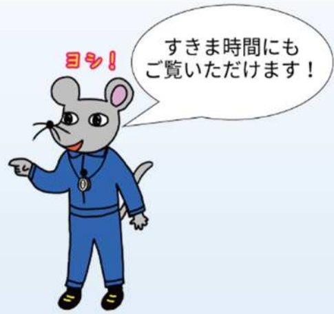
厚生労働省熱中症対策キャラクター チューイ カン吉

また、導入しやすい WBGT指数計活用事例 （WBGT値の実測、WBGT基準値に基づく評価等、WBGT値の低減等）を紹介しています。