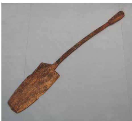
今の農具と変わらない形