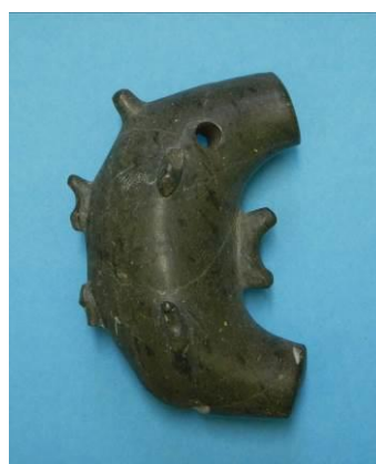
平成22年に発掘された君津市唯一