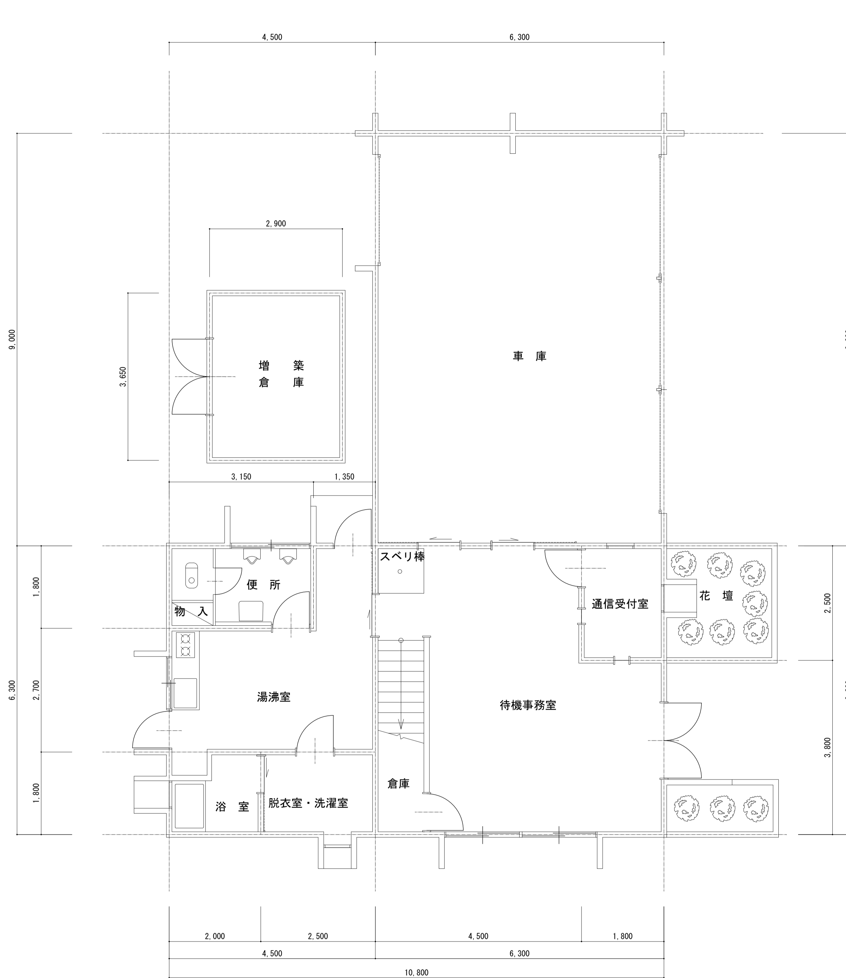
1階 平面図 1/50