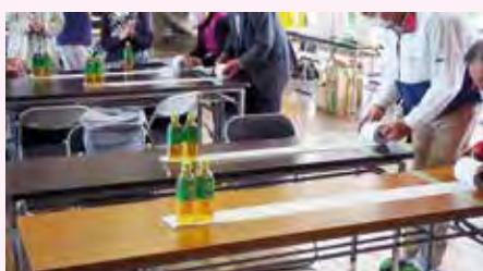
こっ茶こいレース