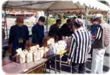
自治会連合会 日用品バザー