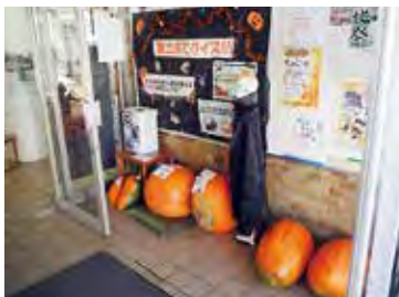
農業講座生が育てました

第49回周南地区文化祭で行った「カボチャの重さ当てクイズ」。答えは60キログラムでした。上位11名には、景品を差し上げました。