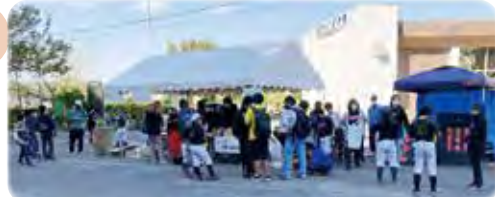
ストラックアウト(景品有)、ゲーム、手作り品・飲み物販売