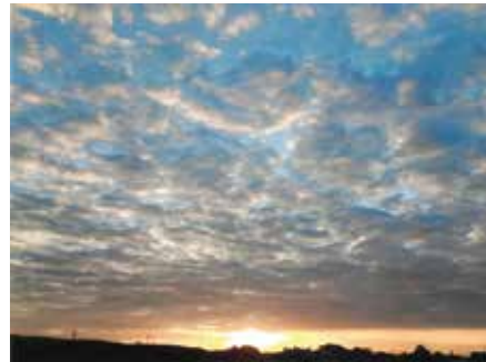
★特別賞(おすすめ風景) 「夕焼けの空」 撮影場所: 常代の新しい道付近