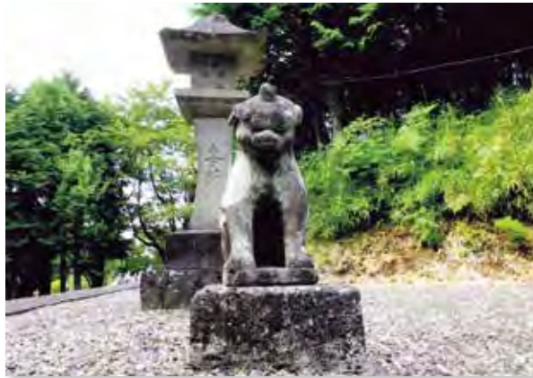
★公民館長賞(好きな風景) 「ケガしてもがんばるよ!」 撮影場所: 常代神社