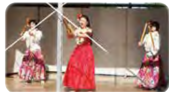
周南ハワイアン ウェイ