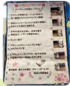
ピラビューティーズ