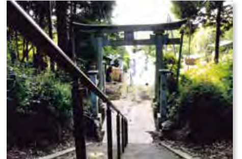
★特別賞(好きな風景) 「すなみのおまもり」 撮影場所: 常代神社

「周南地区青少年を健全に育てる会」では、令和4年度事業として「あい♥らぶ周南フォトコンテスト」を開催しました。周南の小中学生の目線で撮影した「私の好きな周南の風景」、「みんなにおすすめしたい周南の風景」を募集し、周南の素敵な風景が寄せられました。作品をご紹介します。