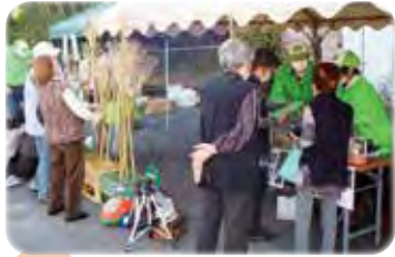
浜子の歴史と景観を守る会 竹炭・竹酢液・竹消臭剤・銀杏 他