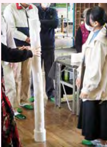
トイレ紙ペーパータワー早積みレース

皆さんで楽しくおしゃべりしながら、認知症についての情報交換をしたり、ちょっとしたためになるミニ講座を行う「おなみほっとサロン」を公民館講堂で毎月開催しています。また、お楽しみタイムとして皆さんが参加できるレクも用意しておりますので、ぜひ足を運んでみてください。 申込不要・出入り自由・参加費は1回100円です。(毎月第三金曜日、午後1時30分~3時30分) 開催予定日 ● 12月16日(金) ● 1月20日(金) ● 2月17日(金) ● 3月17日(金)