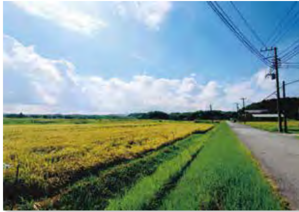
★会長賞(好きな風景) 「いねと空」 撮影場所: 六手神社の前