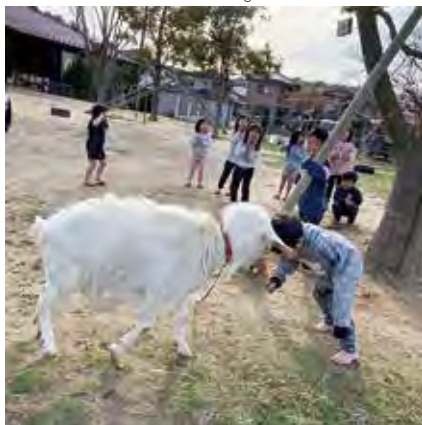
お婚さん募集中です♡