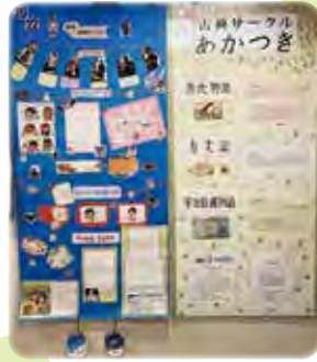
初級日常英会話サークル