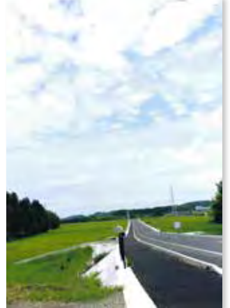
★特別賞(好きな風景) 「わくわくするみさ」 撮影場所: 新しくできた道