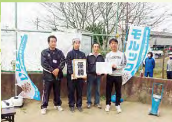
優勝は尾車チーム、おめでとうございます