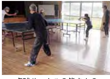
卓球サークルの皆さんの練習の様子

周南地区青少年を健全に育てる会より、卓球ネットのご寄付をいただきました。大変ありがとうございます。