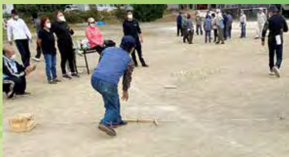
モルックを投げる瞬間