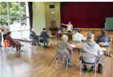
10月25日入門編の様子

10月25日入門編「あんしん・安全にスマホを使う」と11月25日基本編「インターネットを使う」の2回に分けて、ス