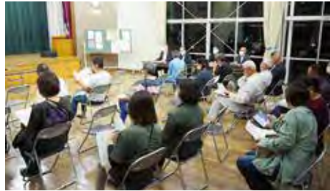
第1回実行委員会結成会議

周南公民館は令和5年(2023年)6月に開館50周年を迎えます。この大きな節目を迎えるにあたり、周南地区・公民館の歴史を振り返り、今後につなげる記念事業を展開していきたいと考えております。