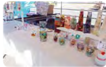
有志 手作り手芸品販売