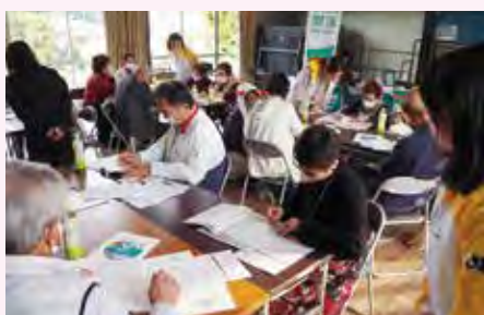
思い出ノートを活用しよう