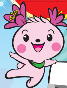
君津市 マスコットキャラクター