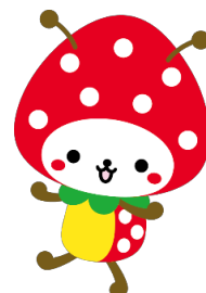
山武市マスコットキャラクター 「SUN ムシくん」