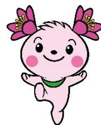
君津市マスコットキャラクター 「きみぴょん」