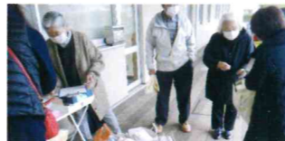
令和3年12月7日 「寄付受付」