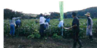
令和3年10月15日 「枝豆収穫祭」