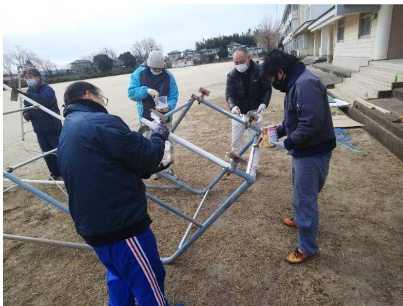
※テニスの審判台の修理などをしているときの様子