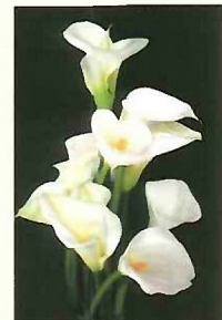
生産量全国No1水生カラー