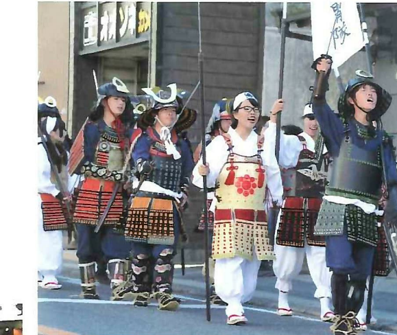
久留里城まつり MAP:H-4 10 2

歩行賞桜花 꽃놀이하이킹 春の花が咲き誇る中、桜を眺めながら市内の自然豊かな場所を歩きます。 Ohanami walking: You can enjoy seeing blooming cherry blossoms and other spring flowers while walking in rich natural environment in the city.