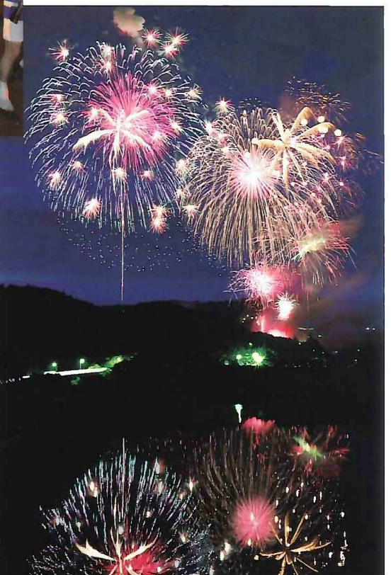
龜山湖(花火大会) MAP:H-6 15

Kururi Castle Festival : The highlight is procession of samurais clad in handmade armor parading through a former castle town.