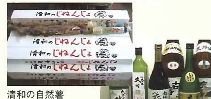
雨城楊枝 小糸の煙火 松丘とうふ 幻の大豆 小糸在来加工品