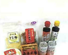
幻の大豆 小糸在来加工品