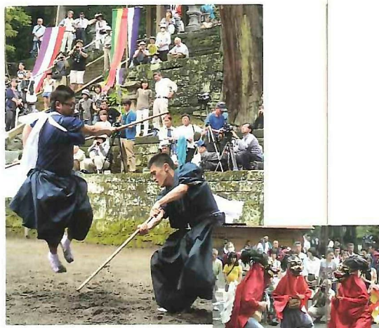
MAP:F-6 三島の棒術と羯鼓舞

三島の棒術と羯鼓舞 ミシマのぼ우주츠와각코마이 三島神社境内で行われ、棒術は、六尺棒や刀等の武具を持って相対し、武術を奉納します。また、羯鼓舞は、竜神が慈雨を降らせたという故事に習い、獅子を舞う雨乞いの神事で、笛の音に合わせて小鼓を打ちながら演じます。(県指定文化財)