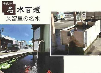
名水百選 久留里の名水