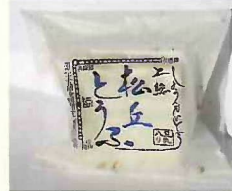
幻の大豆 小糸在来加工品