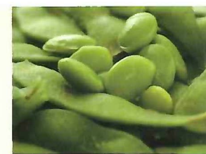
幻の大豆 小糸在来

君津市経済部経済振興課 〒299-1192 千葉県君津市久保2丁目13番1号 TEL 0439-56-1325 ECONOMIC PROMOTION DIVISION KIMITSU CITY HALL 2-13-1 KUBO, KIMITSU-SHI CHIBA KEN (PREF), JAPAN 299-1192 令和3年9月作成 この観光マップは、「入湯税」を活用して作成しています。