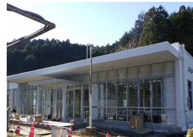
①管理棟玄関施工状況