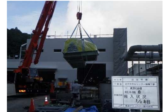
②処理棟脱水機据付状況