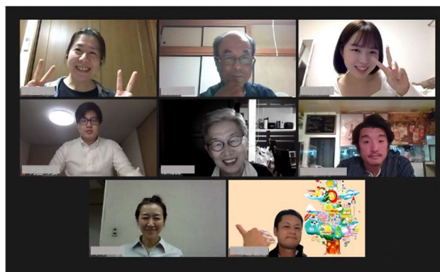
10/14の運営チームオンライン会議の様子

全体の会議とは別に、「運営チーム」（いわゆる幹事会）を設け、精力的にオンラインでの会議を行っています。また、テーマごとにわかれて企画を検討してきた「グループ」も、少人数での会議やLINEなどを使った意見交換に取り組んできました。