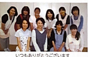
いつもありがとうございます