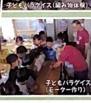
子どもハラゲイス(モーター作り)

夏めく季節、自然は活気に満ち、光が一層輝きを増してきました。平成30年度は中央公民館開館54年目、そして生涯学習交流センターとしては10年目を迎えます。今年度もたくさんの方々の事業を通して交流を深め有意義な一年になるよう取り組んでいきます。 中央公民館では、乳幼児を持つ保護者を対象とした「つくしんぼ広場」、小学生を持つ保護者を対象とした「ほのほの学級・れんげ倶楽部」、君津地区内や貞元地区にお住まいの60歳以上の方々を対象とした「ほのほの学級・れんげ倶楽部」他、「青少年相談員」や「青少年健全育成協議会」の取り組み等季節に応じた様々な主催事業を実施します。下表また今年度から周西小・周西南中学校区での「コミュニティスクール」もスタートしました。地域・学校・公民館が協力し合い、子ども達の健やかな成長をよりいっそうサポートしていきたいと思っております。更なるご理解とご協力をよろしくお願い申し上げます。