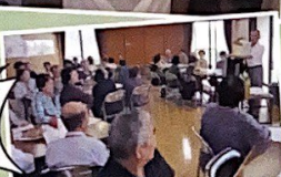
高齢者学級(わんぱく倶楽部)