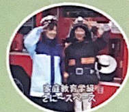
高齢者学級(わんぱく倶楽部)