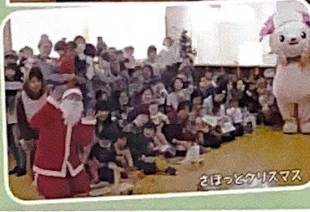
ほのほのクリスマス