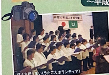
成人を祝う集い(うたごえボランティア)