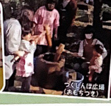
つくしんぼ広場(おもちゃつと)