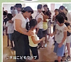
公民館子どもクラブ