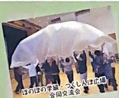
ほのほの学級・つくしんぼ広場 合同交流会