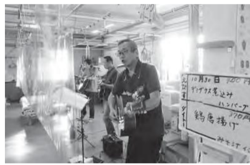
コロナ対策をしながらの慰問

自分も前期高齢者になりませんが、高齢者になって元気がなくなることが当然だと思います。意気込んだ活動ではなく、経験の中でわかることはお伝えし、必要に応じてしかるべきところに繋げていこうという考えを坦々と続けていきたいと思っています。また「向う三軒両隣」のように、地域の人に「隣にこんな人がいると見えやすいように情報を伝え、横のつながりをつくっていくこと」を大事にしながらかつ活動していきたいと思っています。