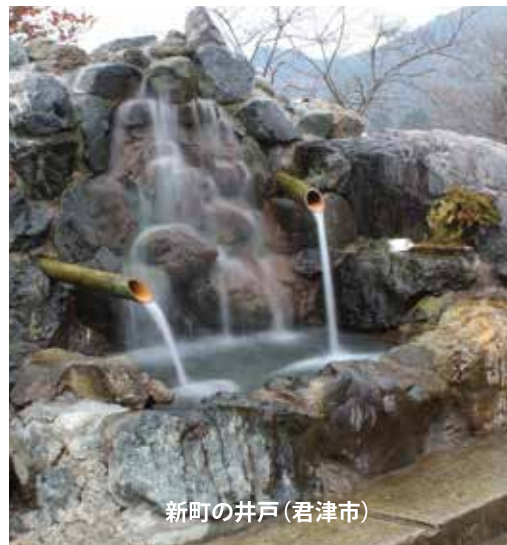
新町の井戸(君津市)