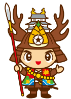
大多喜町 おたっきー