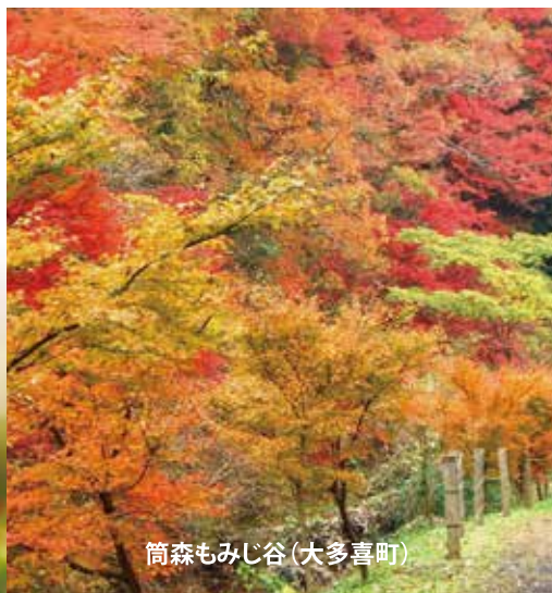
筒森もみじ谷(大多喜町)