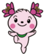
君津市 きみびよん