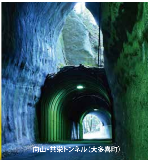
向山・共栄トンネル(大多喜町)