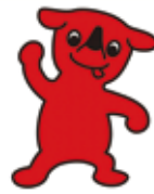
千葉県 チーバくん