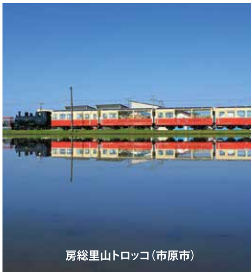
房総里山トロッコ(市原市)