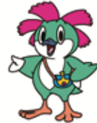
市原市 オツサくん