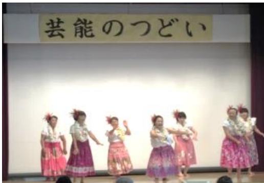
文化祭のピリアロハ・くるりの様子

また、1階のふれあいホールでは、鄙の雛展が令和2年2月22日から開催されます。日頃とは異なる華やかな雰囲気は公民館をぜひご覧ください。