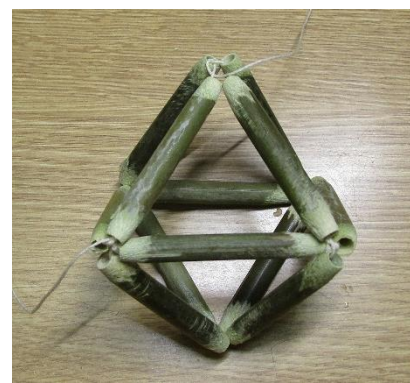
・AB 結びつけた糸を、C の竹に糸通して出てきた糸で赤丸同士を結び付ける ・完成