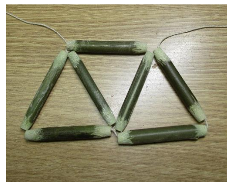
・次の2本糸通し結び