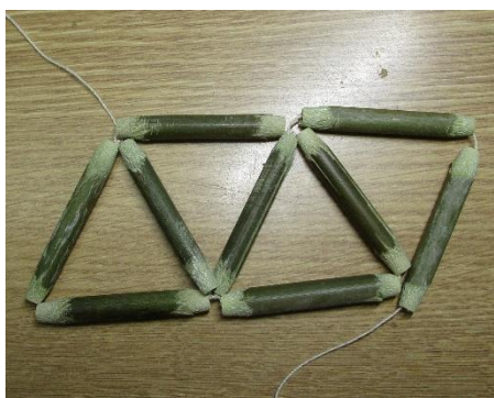
・次の2本糸通し結び