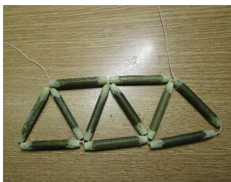
・次の2本糸通し結び 基本形の出来上がり