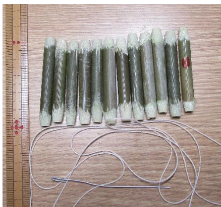
・材料 竹 糸 糸通し

ヒンメリ作り方 (FIC の活動日菅野氏からの情報) ※写真はアズマネザサで作成。ストローで代用可