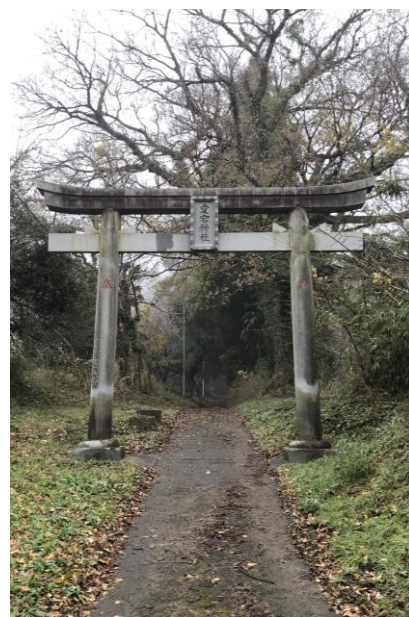
愛宕神社の入り口

【申込み受付】申込み開始：1月6日(月)午前9時から 上総公民館 TEL 0439 (27) 3181 FAX 0439 (27) 3182 （君津市久留里市場192-5）