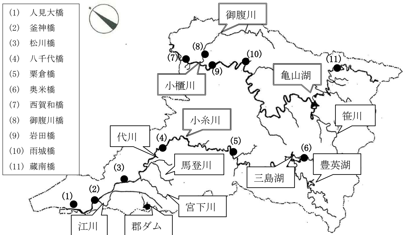
(図 7-1) 河川水質調査地点

本市臨海部には、新日鐵住金(株)等の工場群が立地し、海岸線は人造護岸となっている。東京湾は広域的閉鎖性水域であり、水質は工場・事業場の排水や生活排水の影響を受けているが、排出規制や下水道整備によって一時期に比べて改善されてきたものの、未だ十分とはいえない状況である。