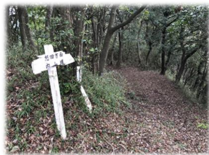
天守から内山堰への山道

【申込み受付先】申込み開始：1月7日（月）から 上総公民館 TEL 0439（27）3181 FAX 0439（27）3182 （君津市久留里市場192-5）