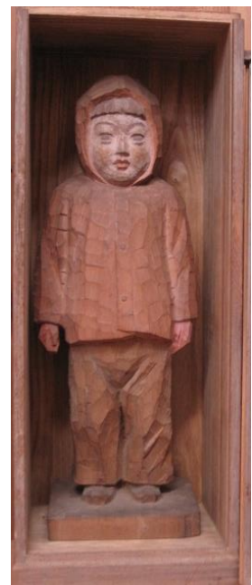
安斉順一「木彫り 赤い手袋」