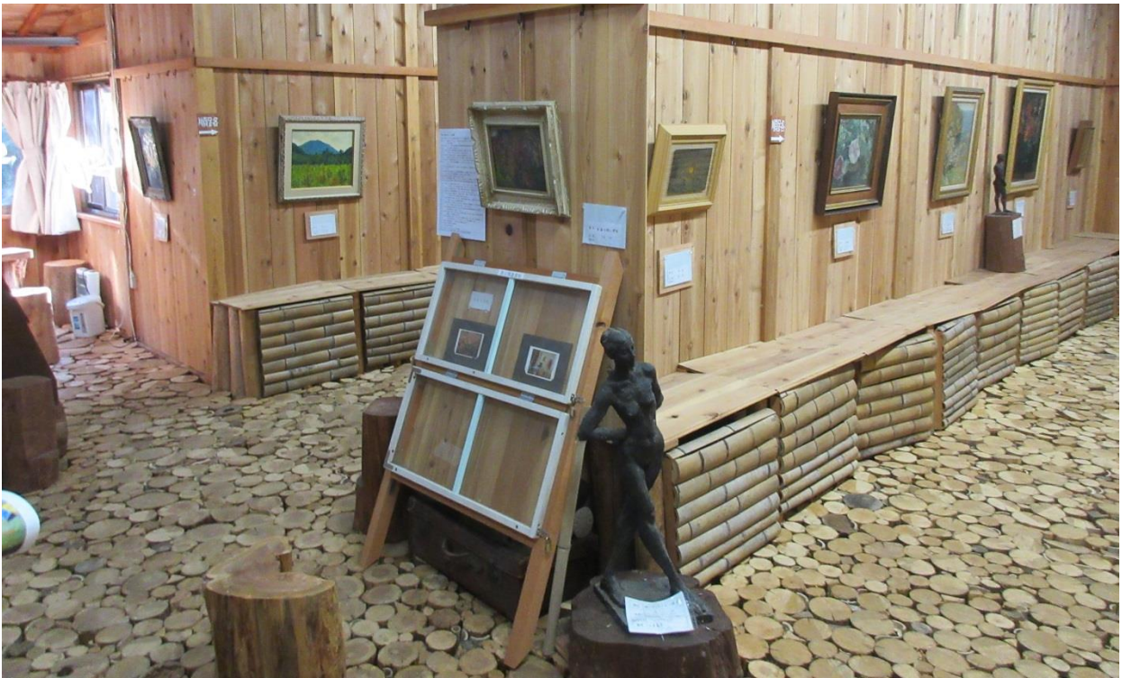
房総郷土美術館内の様子