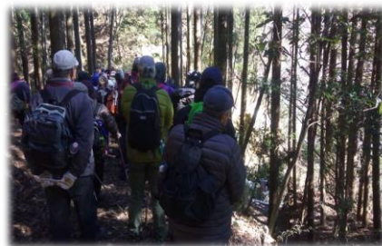
昨年度実施した際の様子

持ち物等：リュックまたはナップサック・飲み物・帽子・汗拭きタオル・雨具・軍手・敷物・お弁当・筆記用具