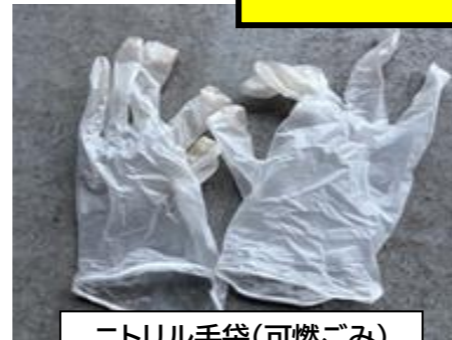
ニトリル手袋(可燃ごみ) ※ゴム製のため