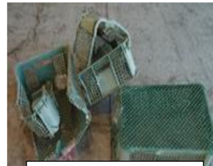
汚れたケース(可燃ごみ) ※汚れているため