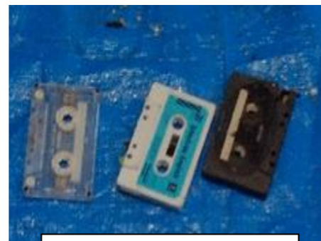
カセットテープ(可燃ごみ) ※100%プラ製ではないため