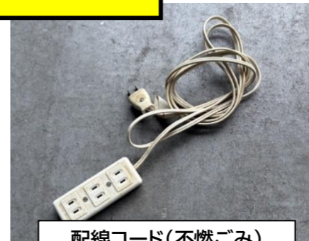
配線コード(不燃ごみ) ※100%プラ製ではないため