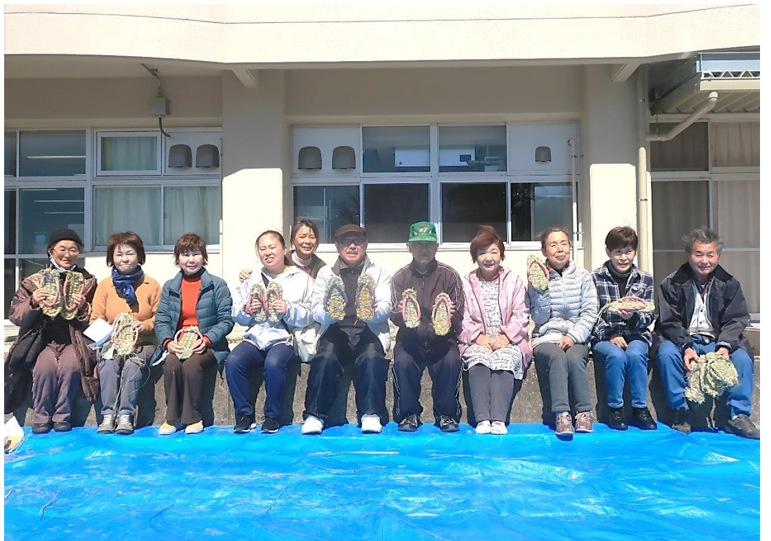
完成した藁草履を持って撮った集合写真。みなさん満足そうな表情で写っていますね～！良い記念になったのではないのでしょうか？