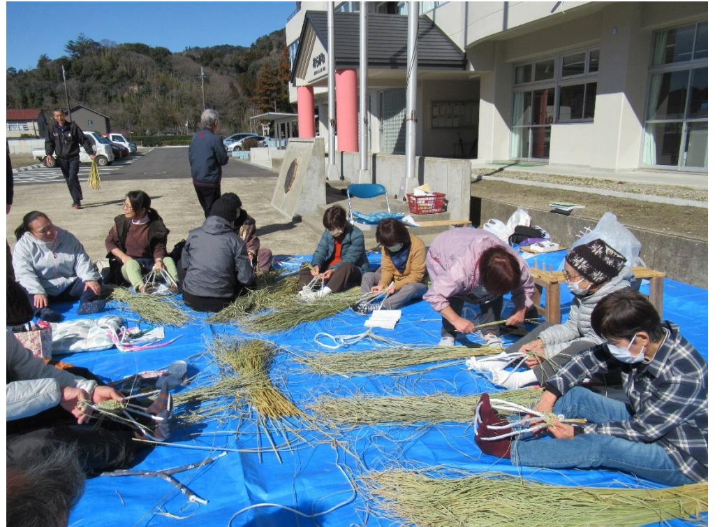
当初は屋内での活動を予定していましたが、雲一つない晴天だったため、屋外で日向ぼっこをしながら藁草履を作りました。

「昔は手作りした藁草履を履いて学校へ行っていた」という話を聞いた後、実際に作ってみました。話を聞く限りでは簡単に作れそうでしたが、講師に教わりながらも難しい工程でした。作るのに苦戦したからこそ、両足分の藁草履が完成した時の達成感は大きいもの。参加者は嬉しそうに手作りの藁草履を持ち帰っていました。