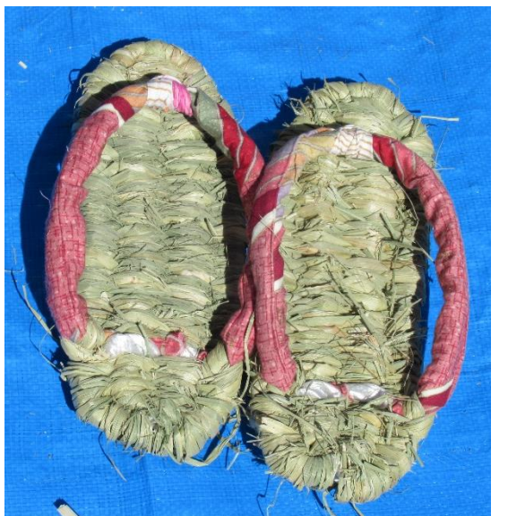
参加者の中には清和地区以外から方や、熱心にメモを取る方もいらっしゃいました。ご家庭でも作って履いてみてくださいと嬉しいです。