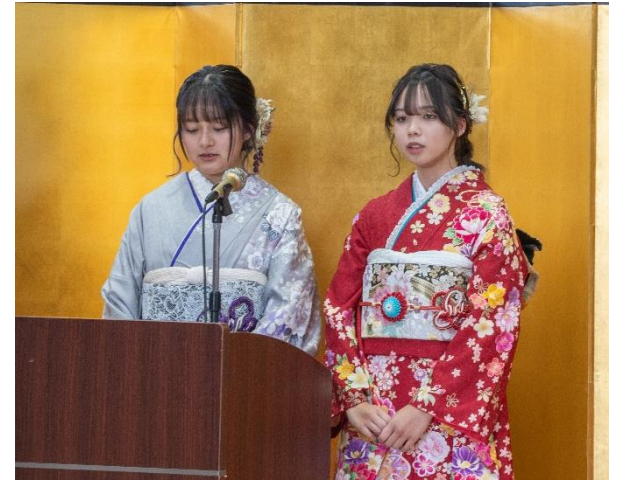
司会や祝電披露など、当日の運営は全て実行委員が担いました。