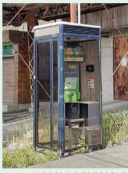
ヤスミ建材(株)事務所付近